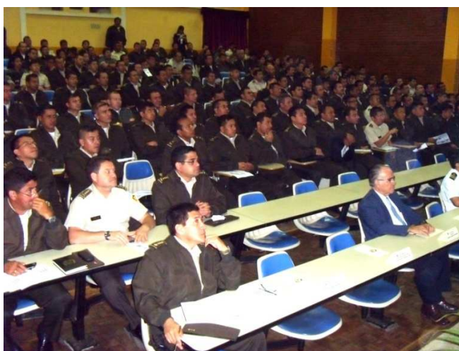
Reunión informativa realizada en el Comando Superior de Educación del Ejército de Guatemala -COSEDE-