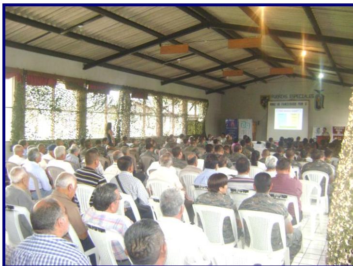
Reunión informativa realizada en el Comando Regional de Entrenamiento de Operaciones de Mantenimiento de Paz -CREOMPAZ-

En el artículo 17, literal j), de la Ley Orgánica del IPM, reformado por el Decreto No. 21-2003 del Congreso de la República, se establece que la Junta Directiva "anualmente convocará a una reunión de afiliados y beneficiarios del Instituto de Previsión Militar, para informar de la situación general de la entidad y de los resultados de la auditoria externa".